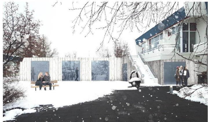
Mynd 4. Hugmynd – tengigangur séður frá stétt milli húsa

Stjórnendur beina hér með þessari hugmynd til hluaðeigandi að leggja í vinnu við hönnun tengigangs milli heimavistar og kennsluhúss ME. Slík tenging hefði mikið hagræði í för með sér fyrir samnýtingu beggja húsa yfir vetrartímann. Þessi hugmynd var unnin af starfsmanni skólans til að ýta verkefninu úr vör. Við vonumst eftir skilningi og jafnvel smá fjárveitingu til að ýta hönnunarvinnu af stað.