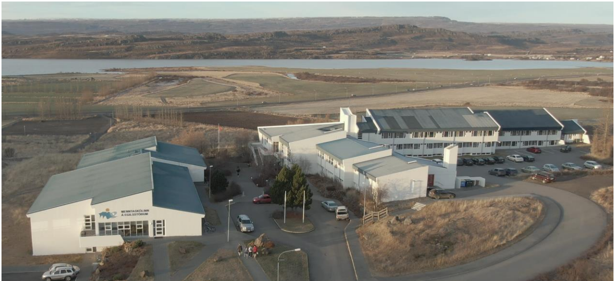
Skólabyggingar Menntaskólans á Egilsstöðum, október 2019.

Byggingar Menntaskólans á Egilsstöðum eru staðsettar við Tjarnarbraut 25.